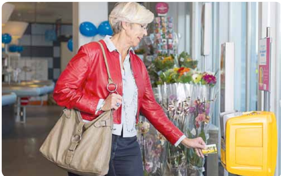
Een ophaalpunt voor de OV-chipkaart.

Dat regelt u bij de NS-kaartautomaat. Kies op het scherm voor 'Laden overige producten', vervolgens voor 'Toeslag 2-1 Keuzedag', betaal en houd uw OV-chipkaart voor de kaartlezer.