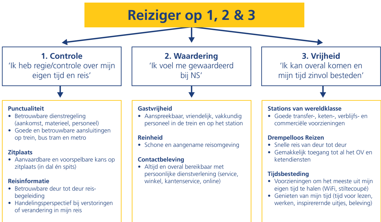
Figuur geeft de sturingsaanpak van NS op de klanttevredenheid weer.